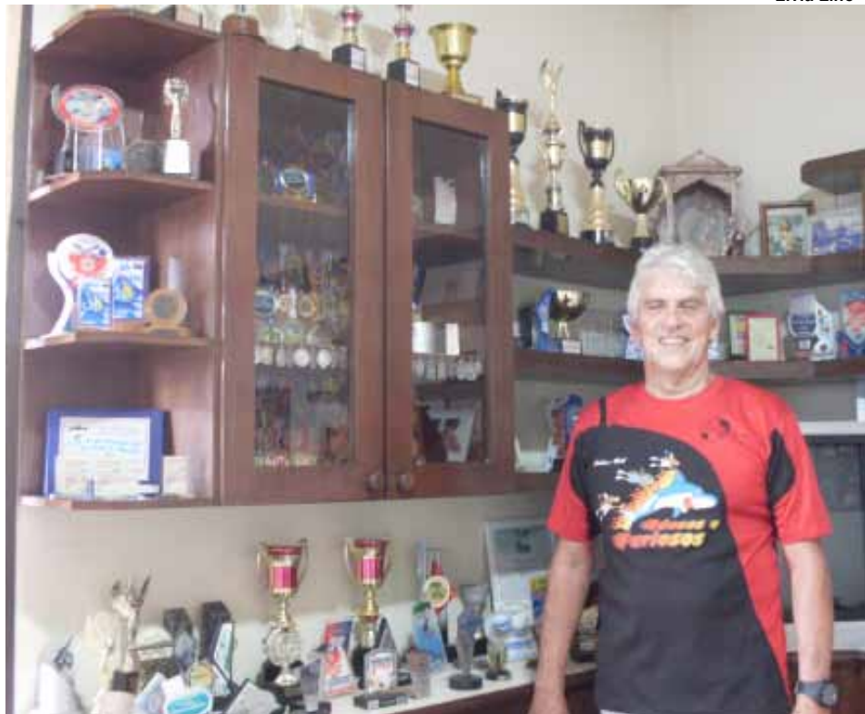
Ondamar Silva é recordista mundial e está no ranking da FINA entre os cinco melhores nadadores em sua categoria.