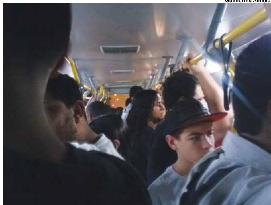
Aumento na tarifa desagradou usuário que quer melhorias